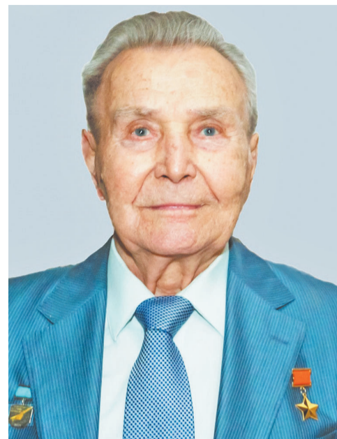
гражданином Северо-Байкальского района, его имя носит Нижнеангарская СОШ №1.